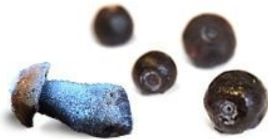
Свежие ягоды и грибы