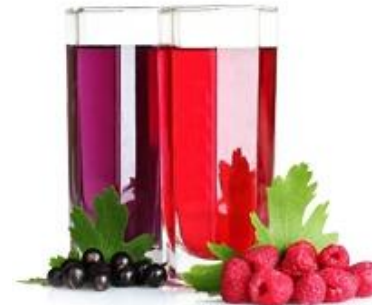
Соки и нектары, джемы и варенье